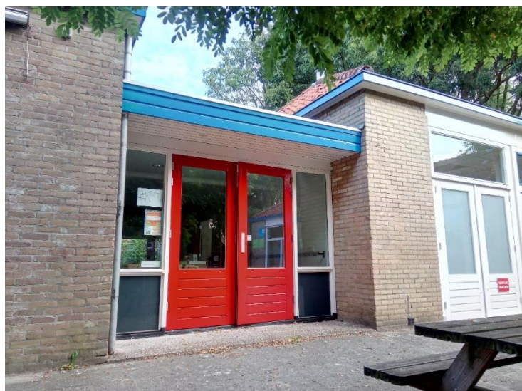
De nieuwe ingang voor groep 1 en groep 2

Donderdag bent u tussen 8.30 en 9.00 uur van harte welkom om een kijkje te nemen in de klas van uw kind en het vernieuwde gebouw. U kunt dan ook aangeven of er manieren zijn waarop u de school wilt ondersteunen (hulpouder Columbus, Ontdekkasteel, begeleider excursies, gastles, kleine reparaties/onderhoud etc).